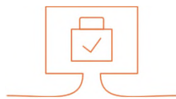
IT- und Datenschutzrecht