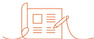
Öffentliches Bau-, Planungs- und Umweltrecht