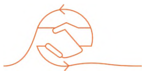
Gesellschafts- und Handelsrecht